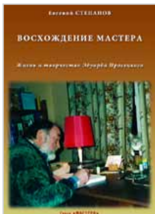
Евгений Степанов «Восхождение мастера» М.: Вест-Консалтинг, 2013