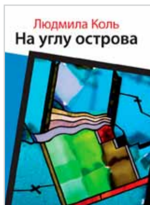
Людмила Коль «На углу острова» М.: Вест-Консалтинг, 2013