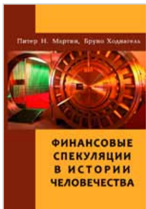
Питер Н. Мартин, Бруно Ходнагель «Финансовые спекуляции...» М.: Вест-Консалтинг, 2013