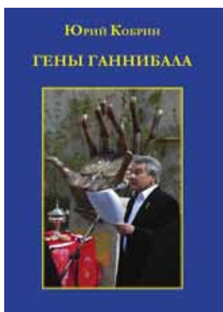
Юрий Кобрин «Гены Ганнибала» М.: «Вест-Консалтинг», 2013