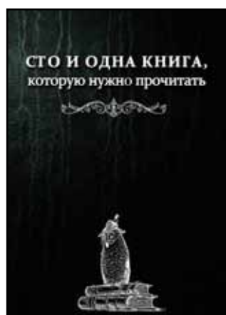
Николай Никулин «Сто и одна книга, которую нужно прочитать» М.: «Вест-Консалтинг», 2013