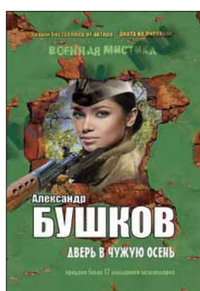
Александр Бушков «Дверь в чужую осень» ДИПик «Капитал», 2015