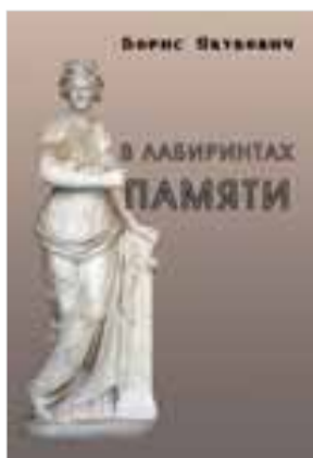
Борис Якубович «В лабиринтах памяти» М.: «Вест-Консалтинг», 2015