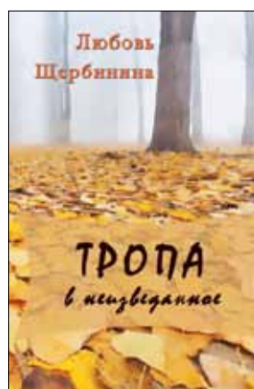
Любовь Щербинина «Тропа в неизведанное» М.: «Вест-Консалтинг», 2015