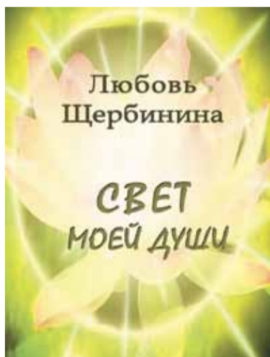
Любовь Щербинина «Свет моей души» М.: «Вест-Консалтинг», 2016