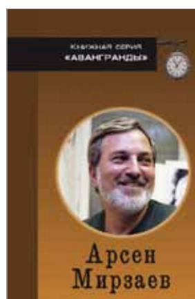
Арсен Мирзаев «Жизнь в 3/4»