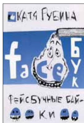
Катя Рубина «Фейсбучные байки»