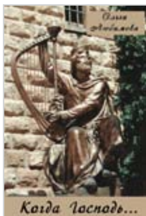
Ольга Любимова «Когда Господь...» М.: «Вест-Консалтинг», 2014