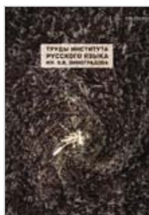
Труды Института русского языка им. В. В. Виноградова М.: «Вест-Консалтинг», 2014