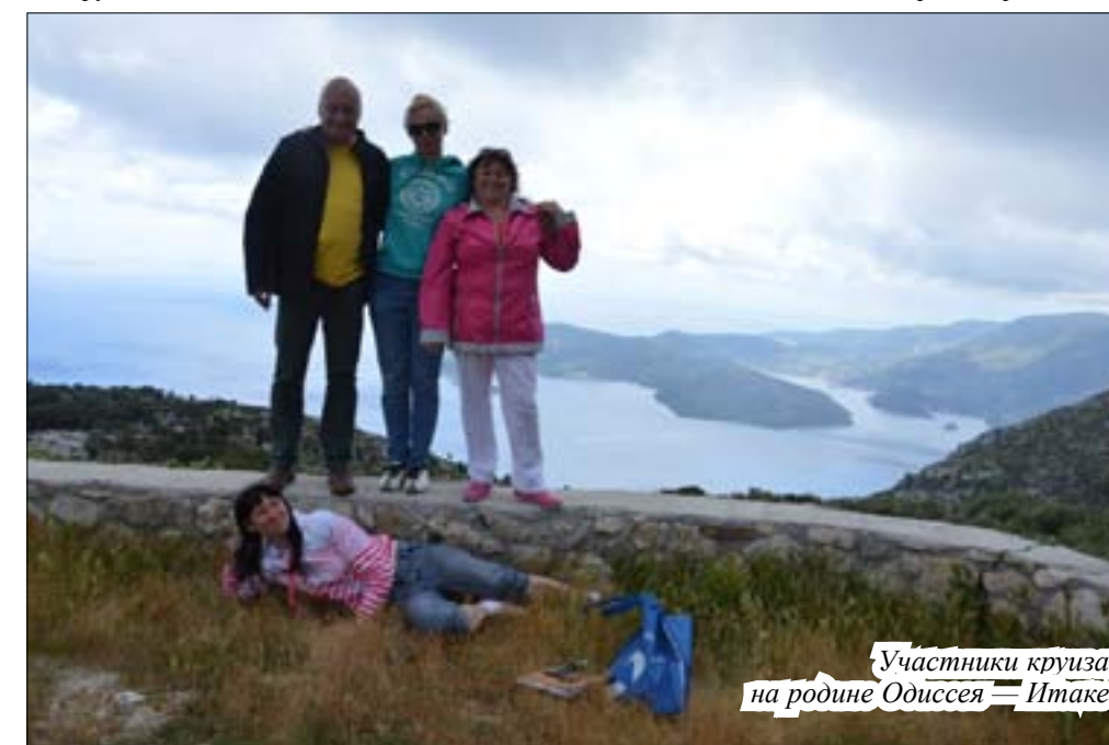
Участники круиза на родине Одиссея — Итаке

620 миль по Эгейскому и Ионическому морям прошли с 17 мая по 1 июня участники литературного «Круиза Серебряного века», посвященного античности и ее осмыслению русскими поэтами-символистами.