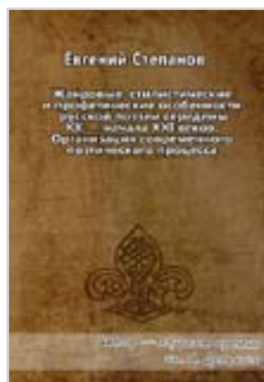
Евгений Степанов «Жаировые, стилистические и профетические особенности русской поэзии...» М.: «Комментарии», 2014