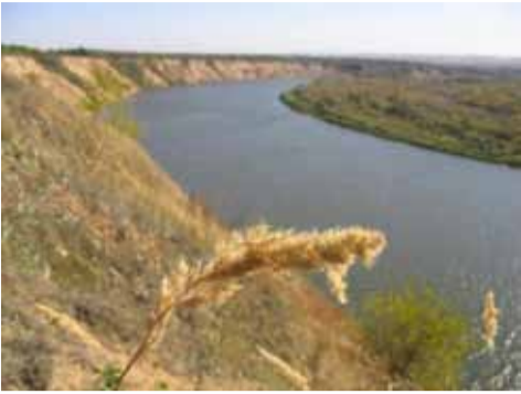
Лебязжий яр на Верхнему Дону. Любимое место Михаила Александровича Шолохова