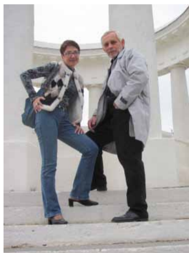
Сталинская ротонда на берегу Цимлянского моря.