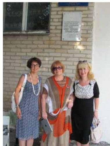
Мечетинская средняя школа. На памятной доске начертаны примеровские стихи: «Я Русь люблю!..»