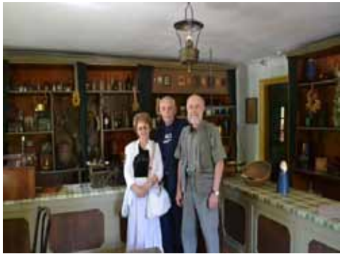
Как не зайти в Чеховскую лавку, где Антоша подсмотрел многих своих героев!