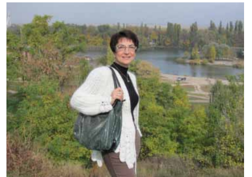
Нижний Дон у древнего Азова