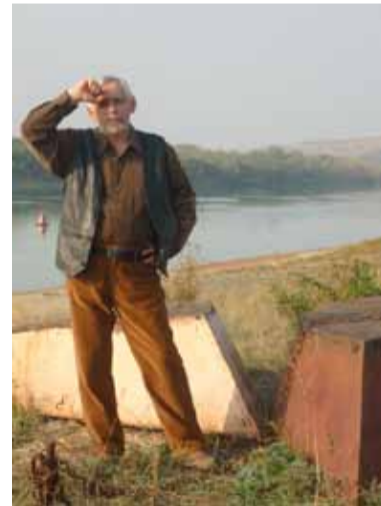
На Среднем Дону