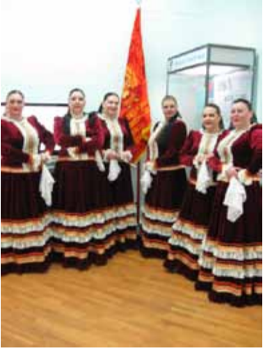
Под орденосным знаменем – азовские казачки из народного ансамбля песни и пляски, пришедшие поздравить величальной песней любимый журнал «Дон» со славной датой.