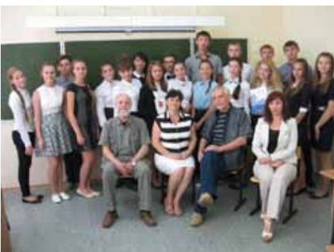
Редакция журнала «Дон» охотно встречается с юными читателями на конференциях, обсуждениях. На этот раз сельские ребята внимали гостю из Архангельска – писателю и члену редколлегии журнала «Дон» Михаилу Попову