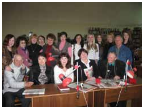
Донские авторы журнала и студенты Новочеркасского политехнического института взаимно довольны встречей.