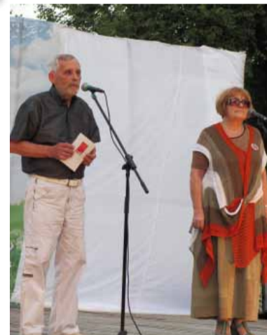
Станица Мечетинская помнит Бориса Примерова, и здесь ежегодно в его честь устраивается праздник «Поющее лето», инициированный и журналом «Дон». Выступление на станичном майдане.