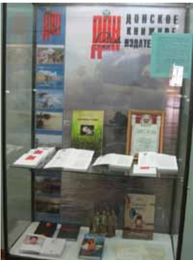
Один из семи выставочных разделов в Азовском краеведческом музее.

Да, журнал «Дон» жив святым духом, что явлен в двух