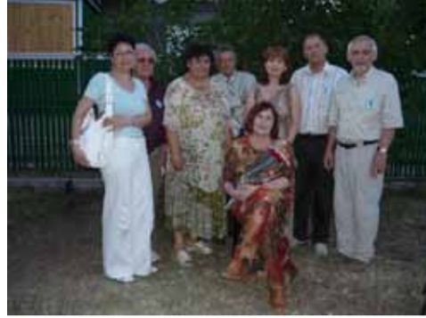
Авторы журнала «Дон» – желанные гости на празднике «Поющее лето».