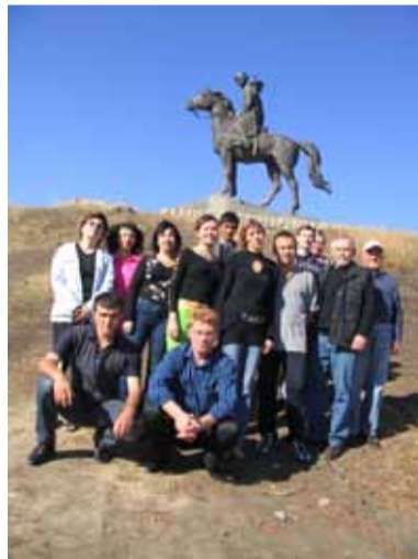
Редакция журнала «Дон» провела форум молодых писателей Юга России на родине Шолохова.