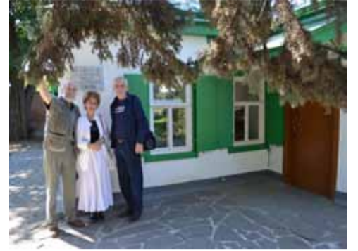
Таганрог. Домик Чехова – святое место.