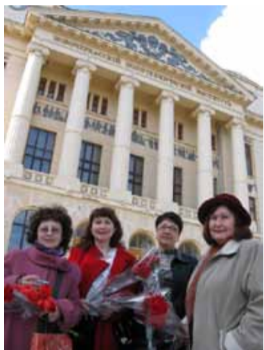
Новочеркасск. После творческой встречи в казачьем политехе, где дважды выступал В. В. Маяковский.